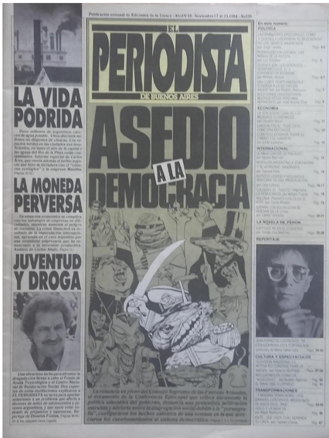
Portadas de EP n° 10, noviembre 17 al 23

Sórdidos banqueros, periodistas, curas y pistoleros, acompañados de una señora de la alta sociedad, rodeaban en otra viñeta de Nine a un militar representado como caballo, para conformar la alianza golpista. Las ediciones que concluyeron el año daban cuenta, con preeminencia de los titulares resonantes por sobre las representaciones gráficas, del respaldo al compromiso por el Beagle (11), la crisis interna del justicialismo opuesto a dicho acuerdo (12), un reportaje al ministro de economía Bernardo Grinspun con bajadas textuales que sugerían la adopción medidas progresistas (13), la detención del teniente y represor Alfredo Astiz en Francia (14), la especulación financiera, presentada como golpe (15) y, correlato de la anterior, en reclamo de la nacionalización de la banca y del comercio exterior (16).