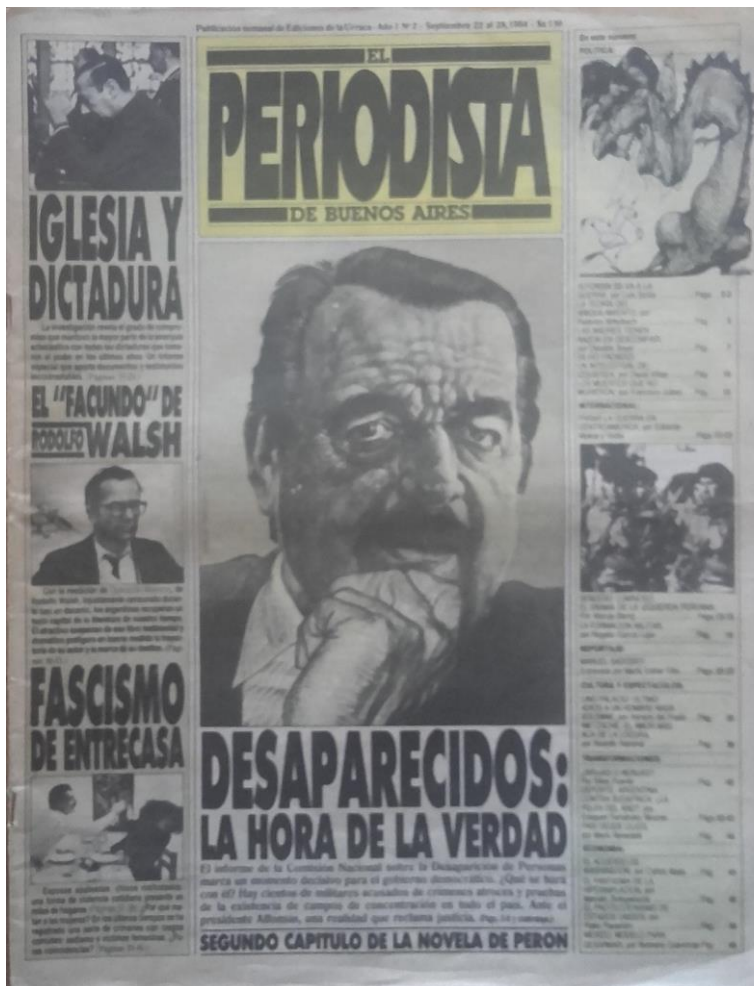
Portada de EP, n° 2, septiembre 22 al 28 de 1984.

Seguir su secuencia permite advertir las temáticas privilegiadas de editorialización de acuerdo con la coyuntura y su modalidad de enunciación. El titular principal inaugural, Kissinger al rescate de la patria financiera , cuestionaba la colusión económica entre el poder económico local y sus aliados trasnacionales durante la dictadura. El del número 2, Desaparecidos: la hora de la verdad oficiaba de epígrafe al retrato realizado por Cascioli de un presidente Alfonsín atribulado, a poco de haber recibido el informe de la CONADEP. “La encerrona militar” apuntaba en el número 3 al rechazo del Consejo Supremo de las fuerzas armadas a juzgar a las cúpulas militares. Su resolución gráfica mediante una escena de Nine en la que ex dictador Videla