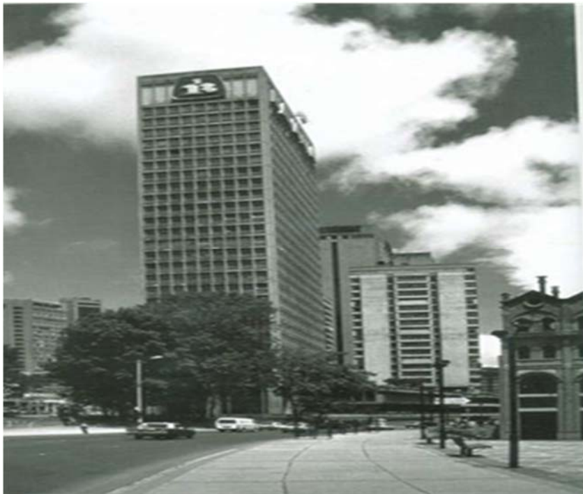
Fuente: Proyecto de renovación urbana parque central Bavaria, Arq. Fernando Jiménez. Consulta electrónica.

Por otro lado, el P.C.B. que va a quedar ubicado en el corazón de esta nueva lógica en la distribución del espacio y va a comenzar a sufrir una presión por el uso del suelo del área central, va a ser la única edificación de la zona que va a tener, por un lado, función industrial, en un área que se va a caracterizar por la prestación de servicios financieros y ejecutivos, y por otro, su vieja estructura de comienzos de siglo no va a estar acorde con las edificaciones que representan la modernización urbana en la cabecera del eje cívico más importante de la ciudad y si se quiere, del país. La empresa Bavaria como tal va a construir también un moderno edificio de oficinas frente a su planta de producción que va a permitir ver el contraste de las edificaciones 4 .