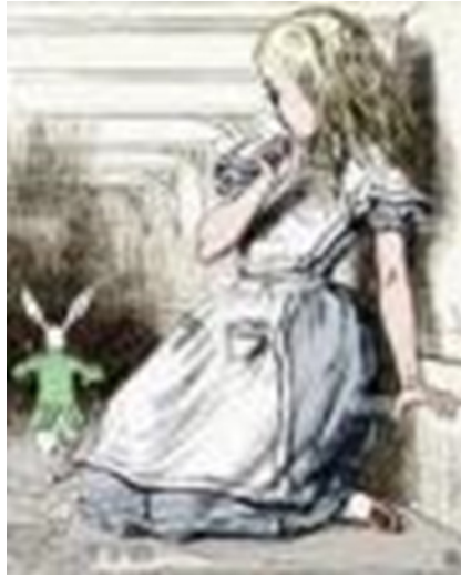
...y Alicia creció, 2017, p. 5.