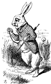
El Conejo blanco, 2017, Cap. I, p. 1.

lo nuevo, lo que movilizaba otra vez, pero ahora era contemplado desde este otro habitar el mundo. Percibiendo el cuerpo como “lugar de existencia y como envoltura: sirve para contener lo que luego será desenvuelto” (Castillo, 2022, p. 70). En este espacio, estaba lo que verdaderamente importaba: las risas, nuestros vínculos, los apoyos, la ternura, y por fin, superadas las distancias físicas. Fuimos siendo testigos de los cambios y nuevas posibilidades, nuevos tiempos, vivencias fuera del encierro, ya no habitábamos escondidos, sino que con imponentes presencias.