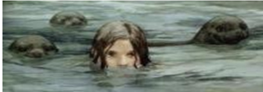
“Piel de foca” (Pinkola, 2015, p. 4)

En este nuevo regreso (pandemia latente y perturbadora aún), es que al menos este grupo de mujeres, logramos romper la linealidad temporal y el silencio; bordeando reflexiones más que certezas en medio de tristezas y alegrías, silencios, miradas, risas, y empatía. Este tiempo de relatos, donde ocupaban lugar nuestras narraciones simultáneas, nos permitió reconocernos frente a las demás y sobre todo acogernos. Un tiempo para abrazarnos y seguir nadando en completa libertad, donde la piel encuentra nuevos ambientes y las experiencias compartidas en comunidad se configuran como proceso de encuentro, cambios, aprendizajes e investigaciones de vida.