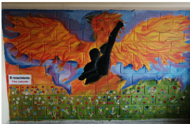
Imagen 1. Ilustración Museo Escolar de la Memoria Institución Educativa Eduardo Santos - Comuna 13 de Medellín, 2018

tantos años de hechos victimizantes y violaciones sistemáticas a los derechos humanos. Las paredes escolares se habían convertido en un extenso lienzo en el que las manos estudiantiles contribuían a una variada galería de imágenes en la que se narraban los dolores, las infamias y las resistencias presentes en los memoriales de la Comuna. Un brillo singular acontecía en la mirada de la maestra narradora cuando luego de relatar historias de despojos violentos, invitaba a apreciar cuadros donde el vivir respiraba de otro modo. Brillo como reflejo de una escena de vida que surgía de las cenizas para encender un fuego vivificante.