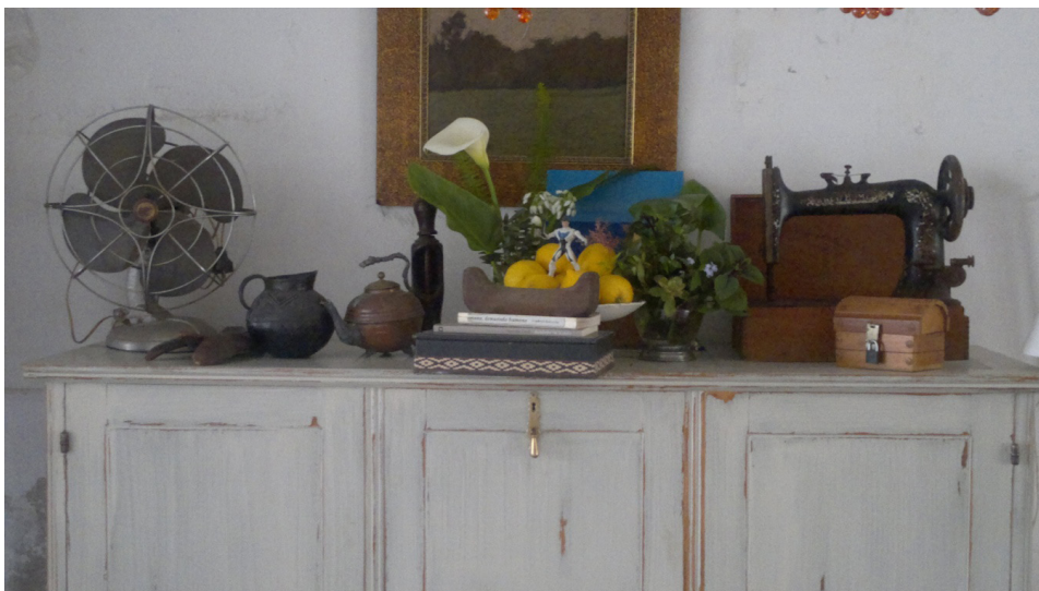
“El Héroe cuir /huir/ en barco de limones”. Escenografía casera, mae.