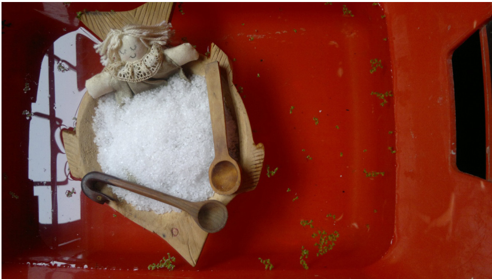
“Encerrada en el mar rojo”. Toma directa c/ celular. Escenografía casera. mae.

Tengo fascinación por meterme en mi propia película. Una vez uno de "Mis Amores" me dijo: "¡para qué vamos a ir al cine! ¿Si la película somos nosotros?" Y así lo siento y pienso cada vez que puedo y necesito salirme de mi realidad cotidiana. Para irme a otra realidad cotidiana. Para descubrir quién soy en