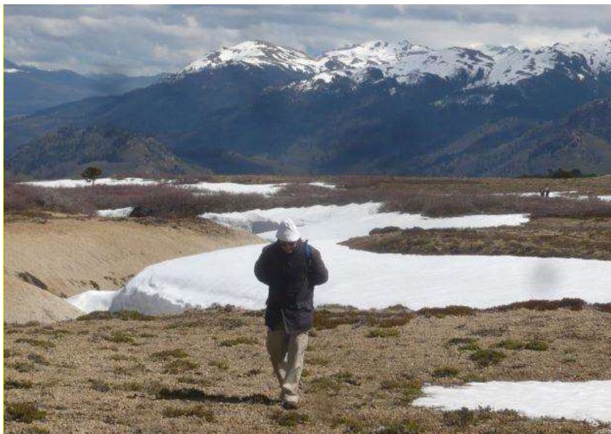
2012. Patagonia Norte. Un largo camino donde la montaña significó un permanente símbolo de esfuerzo en la producción y transmisión de conocimientos. Archivo personal RBC

¡Puedo decir muchas cosas, eh...! [sonríe], porque los recuerdos de esa época..., las preguntas de investigación..., aquellas cosas que te llamaban la atención..., los glaciares cubiertos... los procesos peri glaciares, sentado ahí arriba de una morena viendo ese hielo fósil... se generaba una cantidad de preguntas.... O mirando con ese plan cordillerano que consistió en el relevamiento aerofotográfico de toda la cordillera que tuve la posibilidad de tener a disposición ¿no? En el año '66 se sacó, era una maravilla ver esas planicies de altura a cuatro mil metros. Uno podía imaginar un relieve que se había conformado en otros ámbitos, a otras alturas..., ver todo esa morfoestructura de los Andes Centrales. Eso era...preguntas tras preguntas que... bueno, incentivaron a seguir con esa geomorfología.