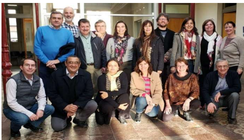
2019-2022- Proyecto conjunto ERASMUS PLUS. EARTH financiado por U.E. Participaron: Italia, Francia, España, Paraguay, Bolivia y Argentina.

tienen sobre el hábitat una relación directa de administración, pero nosotros tenemos muy buena incumbencia en analizar el habitar, la forma que se habitan esos espacios y se autonomizan la mayor parte de las veces de los propios proyectos que la gestión territorial determina, muchas veces a cargo de los arquitectos. Adquieren vida propia los espacios y en eso... estamos nosotros más habilitados, ...digamos más acostumbrados, porque no pensamos desde la legitimidad de imponer un conocimiento técnico en un plano, por ejemplo, en un código, sino estamos pensando en cómo la sociedad ocupa esos espacios, los complejiza de una manera diferente y obliga a cambiar los planos, ¿no? No nos sentimos con la autoridad profesional y con un respaldo de la burocracia estatal, pero sí, observamos y somos capaces de generar una suerte de crítica a esas estructuras estatales. Así que con las disciplinas estamos siempre, con muchas disciplinas interactuando. Y casi todas las formaciones de posgrado son interdisciplinarias.