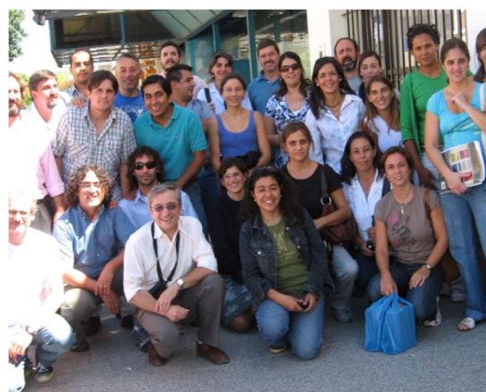
2007-2023. Maestría PLIDER. en Red UNS-UNLP-UNMDP. Formadora en la animación rural y el desarrollo. INTA (Centro Reg. Bs. As. Sur.).