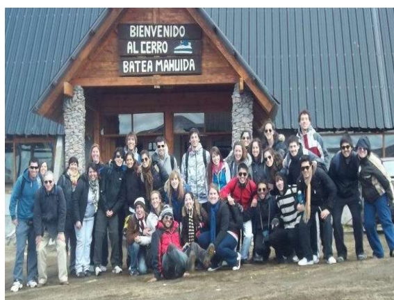
2012. Villa Pehuena. Viaje de Estudio con estudiantes de Geografía y Turismo. Norte de Patagonia. Modelos de integración multicultural en organizaciones de pueblos originarios y procesos locales de desarrollo.

trabajo de acompañamiento de procesos productivos y de acciones colectivas, entre otros aspectos, en términos de desarrollo pero también en términos culturales, en términos de patrimonialización, de construir patrimonios para el turismo o no. Es decir, esa ha sido una experiencia enorme con gente que está en el terreno, que hacía que nosotros participáramos en acciones concretas sobre el terreno, ¿no? Ahí hay una posibilidad.