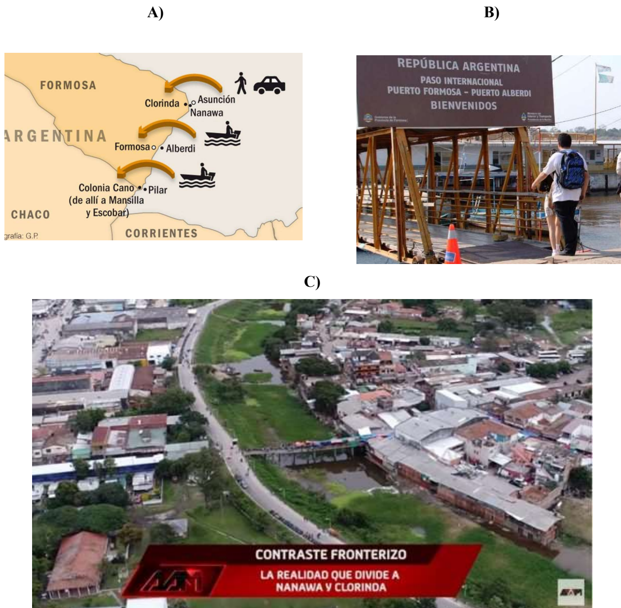
Figura 3. Representación de los pasos fronterizos de la Provincia de Formosa