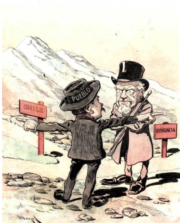
Los tres caminos