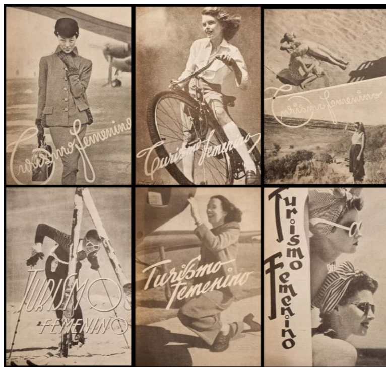
Selección de portadas de la sección "Turismo femenino" de la Guía Peuser (Años 1950, 1951, 1952, 1953, 1955 y 1956)

En su mayoría, las portadas de la sección cuentan con una fotografía con el sobreimpreso "Turismo Femenino" (Figura 1). Todas las fotografías muestran a mujeres jóvenes y hermosas en situación de disfrute en un contexto de inicio de un viaje, inmersas en la naturaleza o realizando algún deporte, sin compañía o a lo sumo con una amiga. Los semblantes de las protagonistas de estas fotografías varían entre la alegría, la