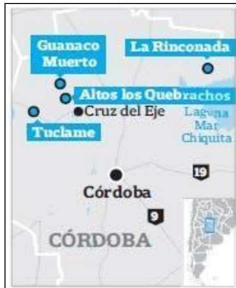
Imagen 6. Mapa Pueblos de Córdoba