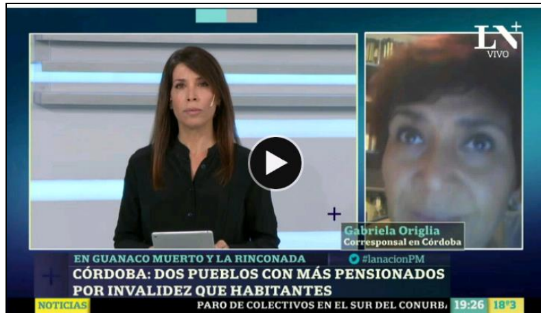
Imagen 5. Fotograma de video