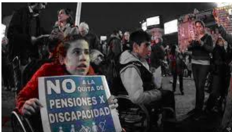
Imagen 2. No a la quita