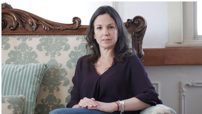
Imagen 9. Carolina Stanley