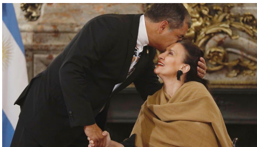
Imagen 10. Gabriela Michetti

Fuente: Gabriela Michetti dijo que el Gobierno estableció por primera vez en la historia una política de discapacidad. (15 de junio de 2017). www.lanacion.com.ar . Recuperado de: https://www.lanacion.com.ar/politica/gabriela-michetti-dijo-que-el-gobierno-nacional-establecio-por-primera-vez-en-la-historia-una-politica-de-discapacidad-nid2034048/ Consultado: 6/7/2020.