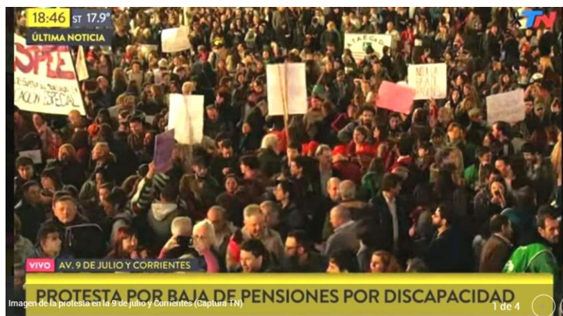
Imagen 1. Imagen de la protesta en la 9 de julio y Corrientes