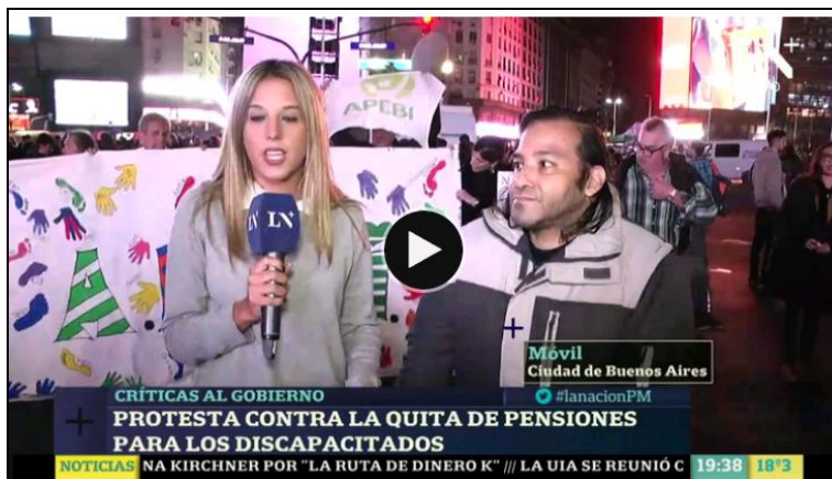
Imagen 7. Protesta Obelisco