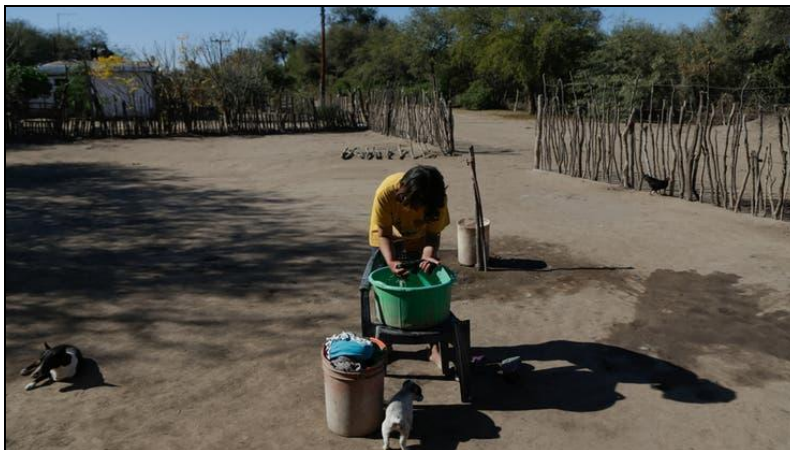
Imagen 11. Guanaco Muerto