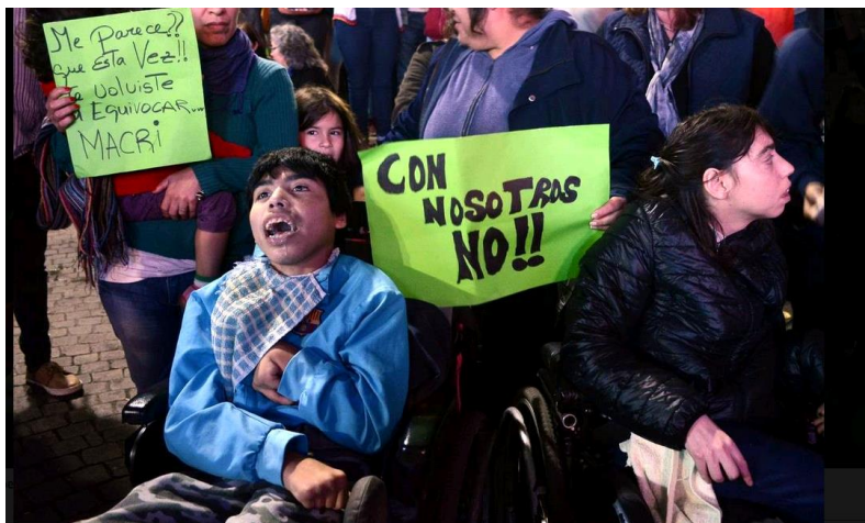
Imagen 3. Con nosotros no