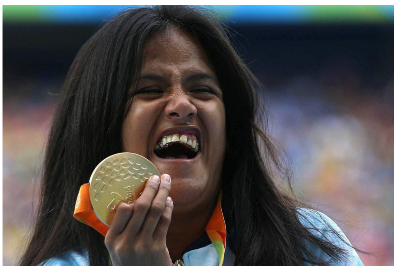
Imagen 8. Medallista paralímpica