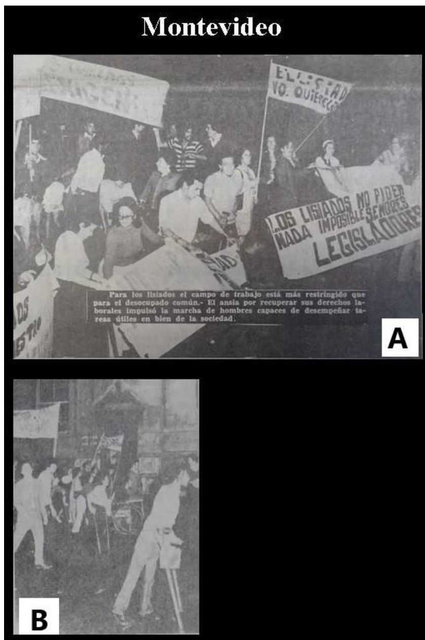
Imagen N° 1 La cobertura mediática de la manifestación callejera en Montevideo