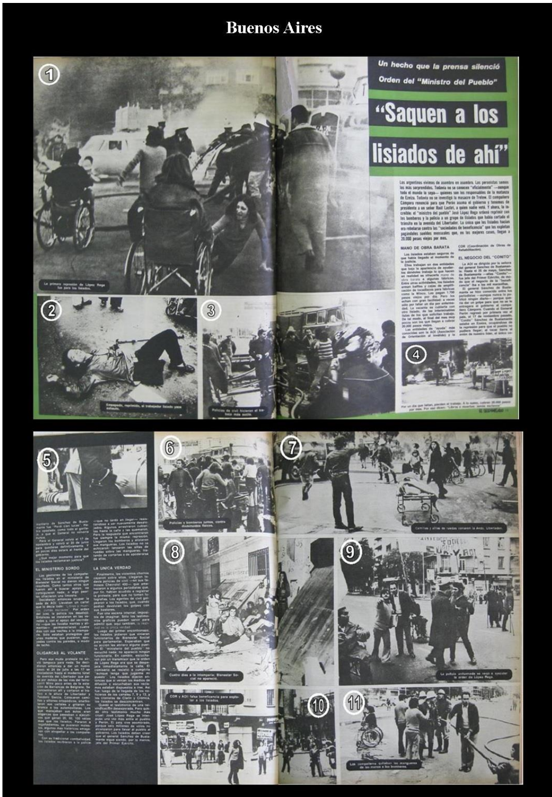
Fuente: El Descamisado , 31 de julio de 1973, pp. 12-15. Biblioteca Nacional de la República Argentina, Buenos Aires.