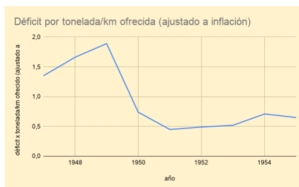
Gráfico 1. Déficit por Tonelada/km ofrecida, ajustado a inflación

La expansión de la red aérea en esos años fue bastante moderada (véase gráfico 3). La red internacional creció al sumarse, en 1950, la ruta a Nueva York; la línea a Europa incluyó nuevas escalas, como Frankfurt y Ámsterdam, y se sirvieron nuevos destinos latinoamericanos. En la faz local se produjeron algunos cambios interesantes. En primer lugar, en 1950 se establecieron servicios regulares entre Tucumán y Roque Sáenz Peña, en el Chaco, vinculando así por vía aérea el noroeste y el noreste del país. 25 En segundo lugar, se completó la conexión de las capitales de provincia con Buenos Aires, cuando Catamarca y la Rioja se incorporaron a las rutas regulares de Aerolíneas y se las enlazó además con Córdoba, San Juan, Mendoza y Tucumán. Finalmente, también en 1952, se habilitó la “Regional Córdoba” convirtiendo al aeropuerto de Córdoba en algo semejante a lo que hoy llamaríamos un “hub” aéreo: contando con dos vuelos diarios a Buenos Aires, desde allí partían servicios al resto de la provincia de Córdoba (Río Cuarto, Villa Dolores y La Cumbre), al sur del país (Bahía Blanca, desde donde se conectaba con la ruta de la costa patagónica), a Cuyo (Mendoza y San Juan), a Tucumán y a la entonces provincia de Eva Perón (hoy La Pampa) y, de allí, a la norpatagonia andina (Neuquén, Bariloche y Esquel). El resultado fue, con un crecimiento modesto del kilometraje total recorrido, un aumento importante de la conexión inter e intra regional.