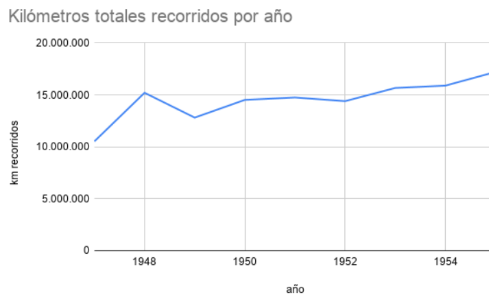
Gráfico 3: Kilómetros recorridos