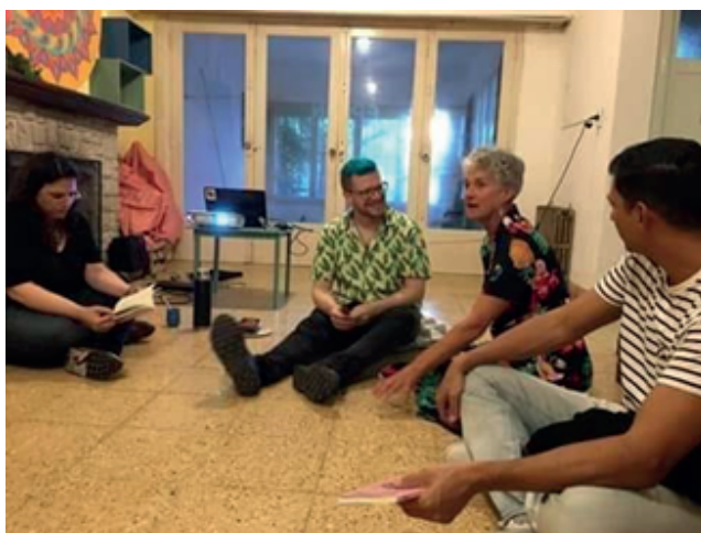
Foto del encuentro