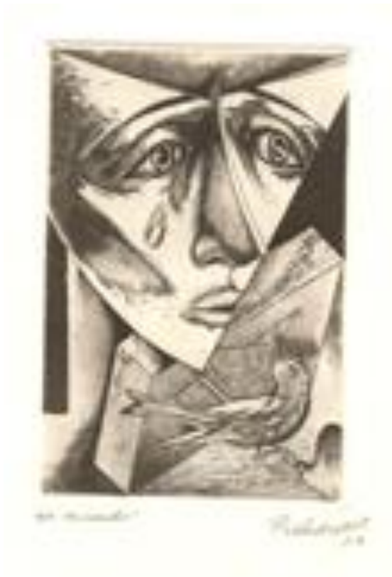
Su mundo, 1957