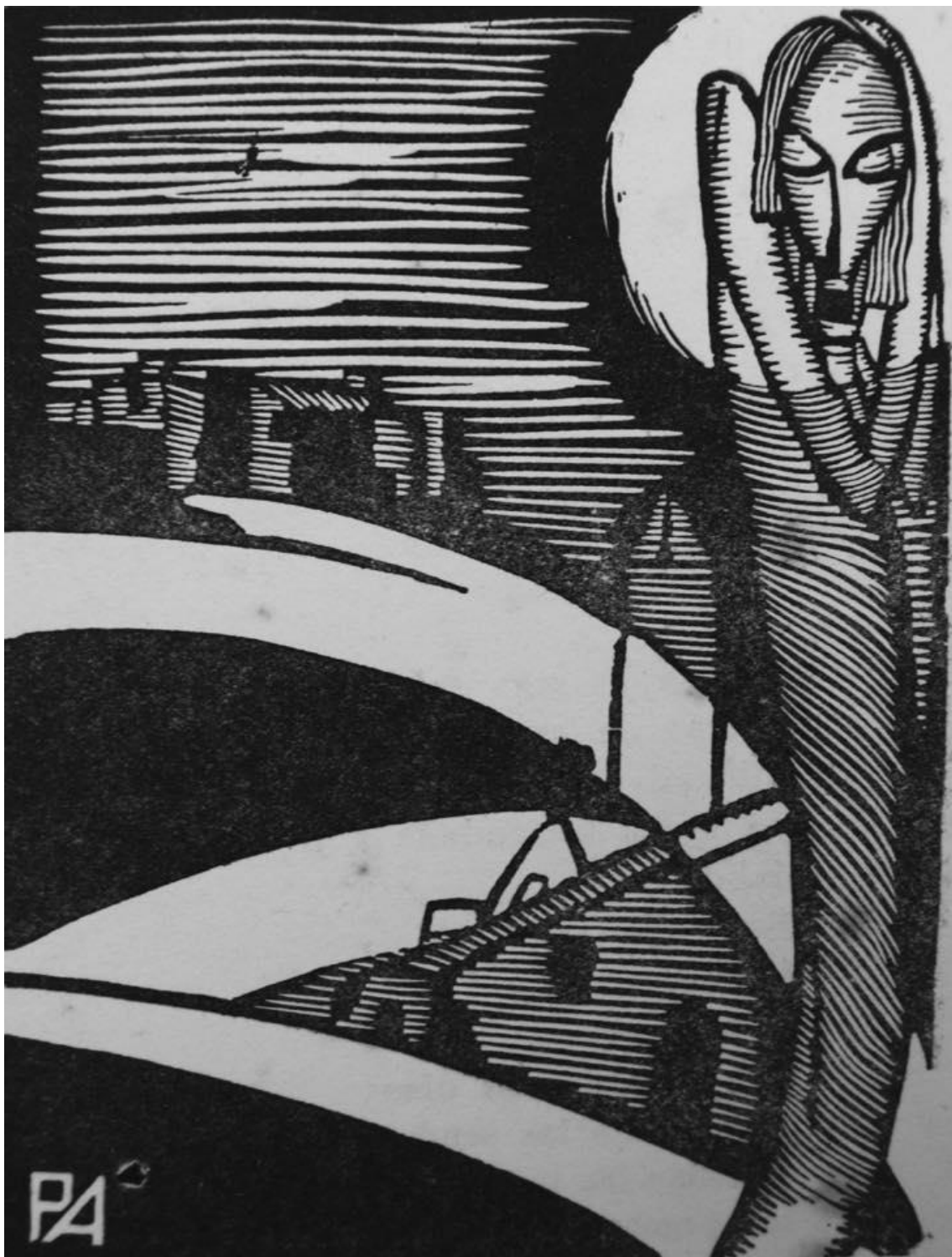
Ilustración para el libro Molino Rojo de J. Fijman, 1926