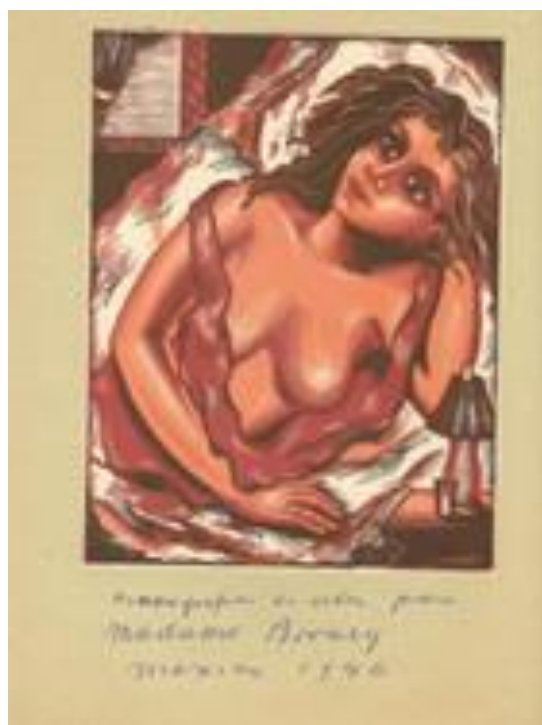
Mme. Bovary, 1946