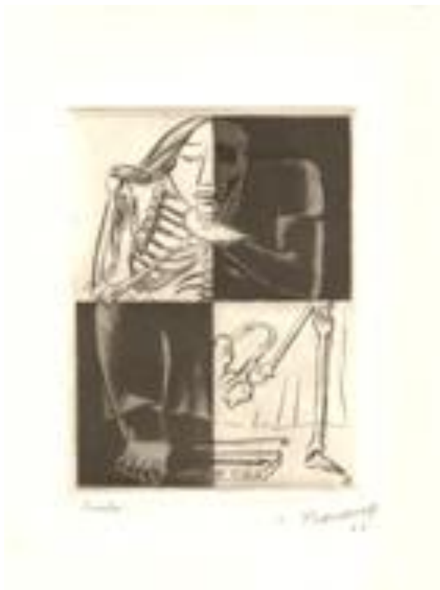
Sueños realizados, 1968.