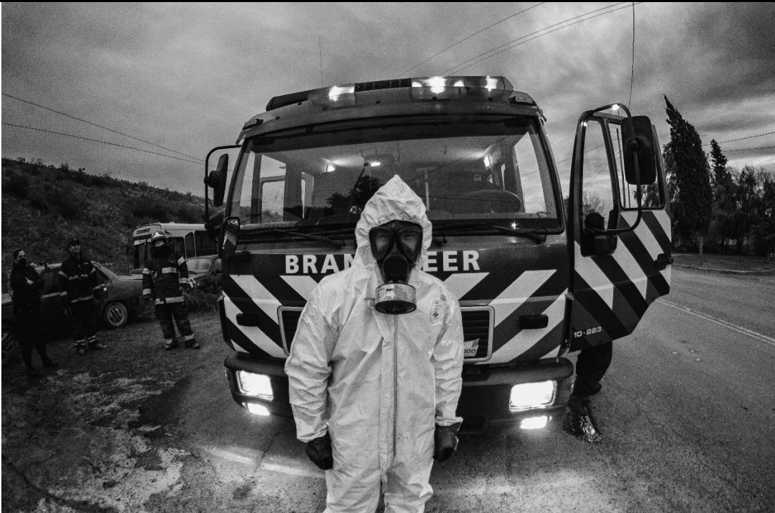
Viedma- 11-06-20. Bomberos realizan tareas de sanitización de espacios públicos durante la pandemia.