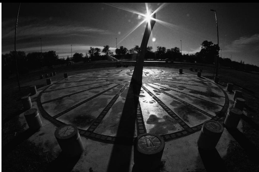
FOTO 6. VIEDMA. 18-06-20. Reloj de sol en la costanera viedmense durante la pandemia.