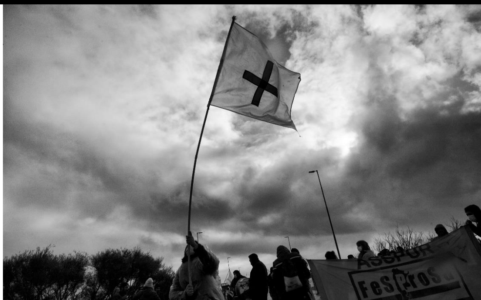
FOTO 7. Rio Negro. Viedma. 01-06-22. Los trabajadores de la salud del Hospital Artémides Zatti nucleados en el gremio ASSPUR realizaron un corte del Puente Basilio Villarino en la búsqueda de mejoras salariales.