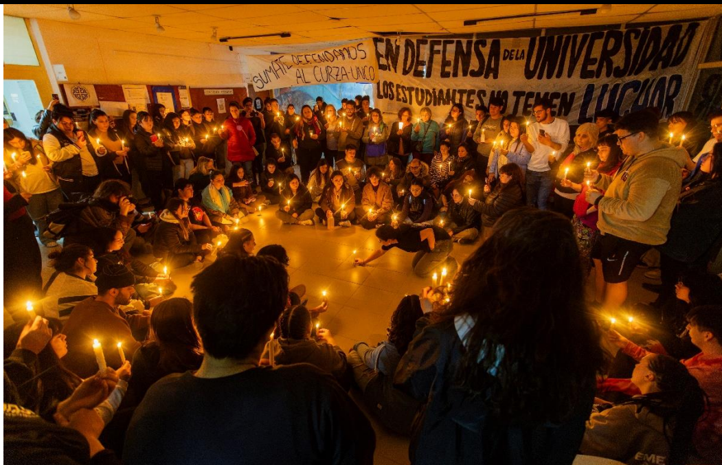
FOTOS 3 Y 4. Rio Negro. Viedma. 09-10-24. Los estudiantes de la Universidad Nacional del Comahue realizaron una vigilia en la sede del Curzas en rechazo al veto de la ley de financiamiento educativo que se ratificó en la Cámara de Diputados de la Nación. El estudiantado se organizó en una asamblea y decidió extender la toma por 24 horas, iluminando el hall central con velas.