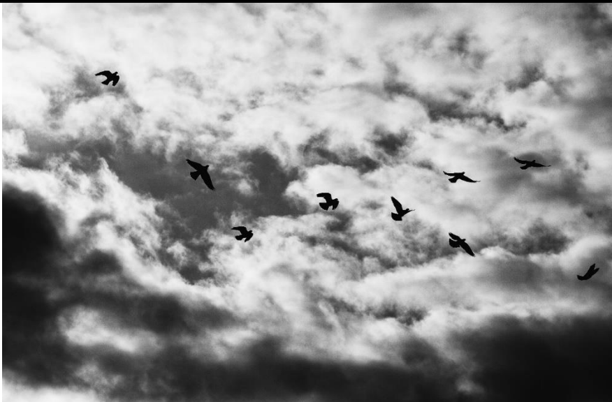
VIEDMA. 18-06-20. Nueve palomas vuelan en el cielo viedmense, durante la pandemia.