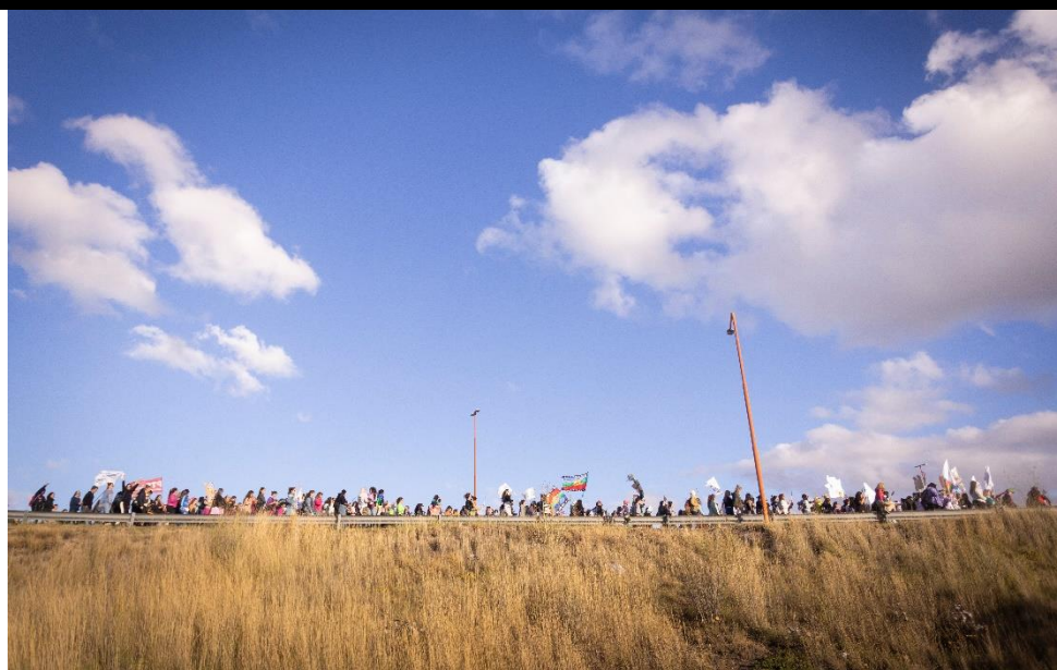
FOTOS 1 Y 2 Río Negro. Viedma. 08-03-25. Movilización por el Día Internacional de la mujer trabajadora, desde el Puente Basilio Villarino por la costanera viedmense, bajo la consigna "Contra el hambre, la crueldad y el saqueo" en rechazo al ajuste del gobierno del presidente Javier Milei.