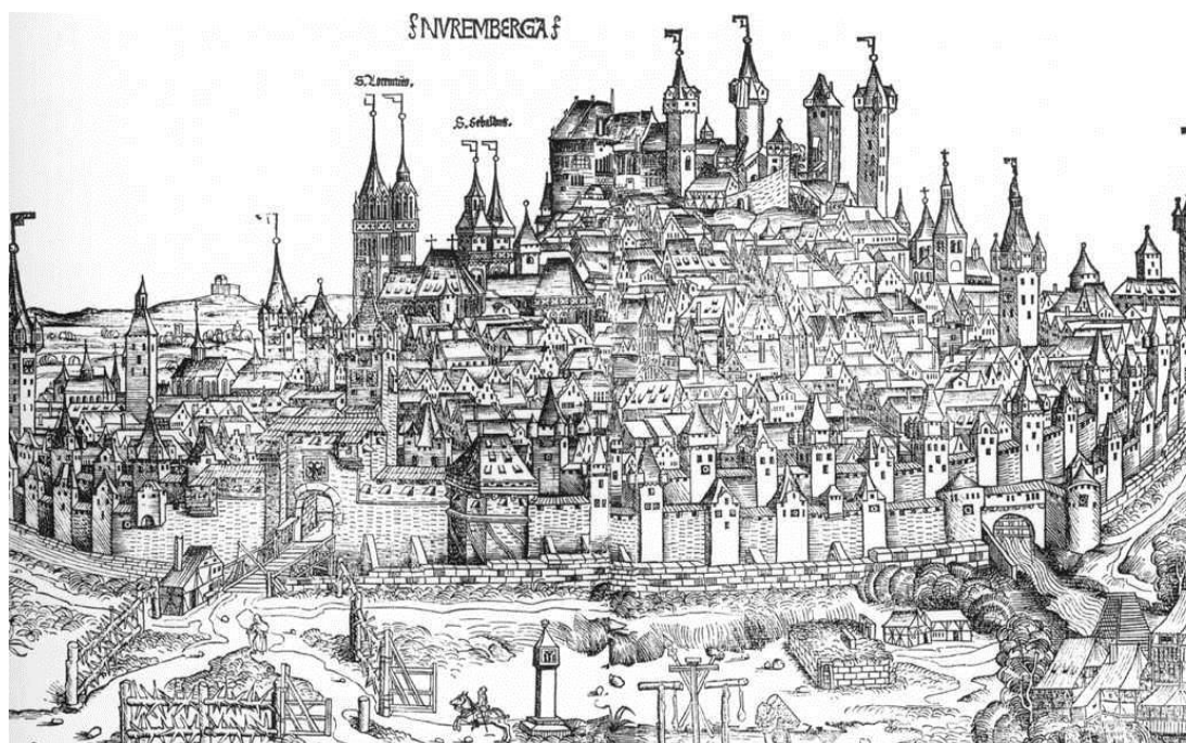
Figura 1. Michael Wolgemut e Hans Pleydenwurff. A vista da cidade de Nuremberg A Crônica de Nuremberg , 1493. Rio de Janeiro, Biblioteca Nacional, f. 99v. – 100r.

Entre as trinta e duas vistas de cidades, baseadas em alguns parâmetros geográficos reais 24 , presentes na Crônica de Nuremberg ; a que se destaca não só pelos seus detalhes, mas também no seu tamanho é a referente à própria Nuremberg. Na figura 1, encontra-se uma das maiores xilogravuras desse livro, localizada nos fólhos XCIX versus e C recto . A vista panorâmica da cidade é sugerida a partir de uma certa distância e de uma altura elevada, como se fosse vista de um monte. As muralhas definem a divisão entre o espaço urbano e o rural, ao centro do topo dessa ilustração nota-se as construções mais importantes da cidade como o Kaiserburg 25 (Castelo Imperial) e mais abaixo, à esquerda, estão presentes as igrejas mais conhecidas de Nuremberg, indicadas pelos nomes dos santos, a mais à esquerda é dedicada a São Lourenço e a mais à direita a São Sebald (padroeiro local).