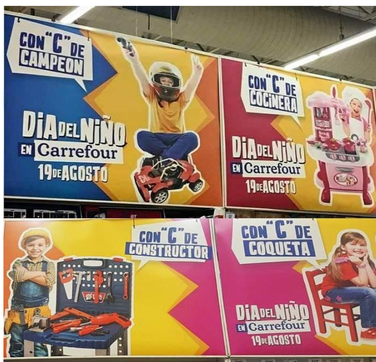
Imagen 1: publicidad del supermercado Carrefour para el Día del Niño 2018.

En el caso de la publicidad seleccionada, que se podía encontrar en los supermercados Carrefour de todo el país, se puede observar la división de géneros desde la primera infancia. Por un lado las niñas son definidas como “cocineras”, respondiendo al preconcepto que supone que las tareas domésticas dentro del espacio privado que representa el hogar deben ser realizadas por mujeres de manera gratuita y obligatoria, y a partir desde esa línea se las entrena desde el nacimiento para cumplir ese rol. Además se las define como “coquetas” que también hace referencia a la idea de pulcritud y sacralidad que históricamente se construyó alrededor de la mujer pero que con los cambios sociales mutó hasta convertirse en la idea de que la mujer debe estar arreglada, prolija, ser femenina, etc. Por otro lado, los niños son representados por la palabra “constructor” ya que ellos también son entrenados desde pequeños para que estén dispuestos a hacer tareas de fuerza donde intervenga el cuerpo, la masculinidad y siempre ligando al varón al sistema de trabajo y el espacio público. Asimismo, se lo denomina como campeón porque otra de las características de los varones para ser aceptados en sociedad es la condición de ser siempre un competidor y un ganador, convirtiéndolos en actores activos dentro de la sociedad, al contrario de la pasividad de las