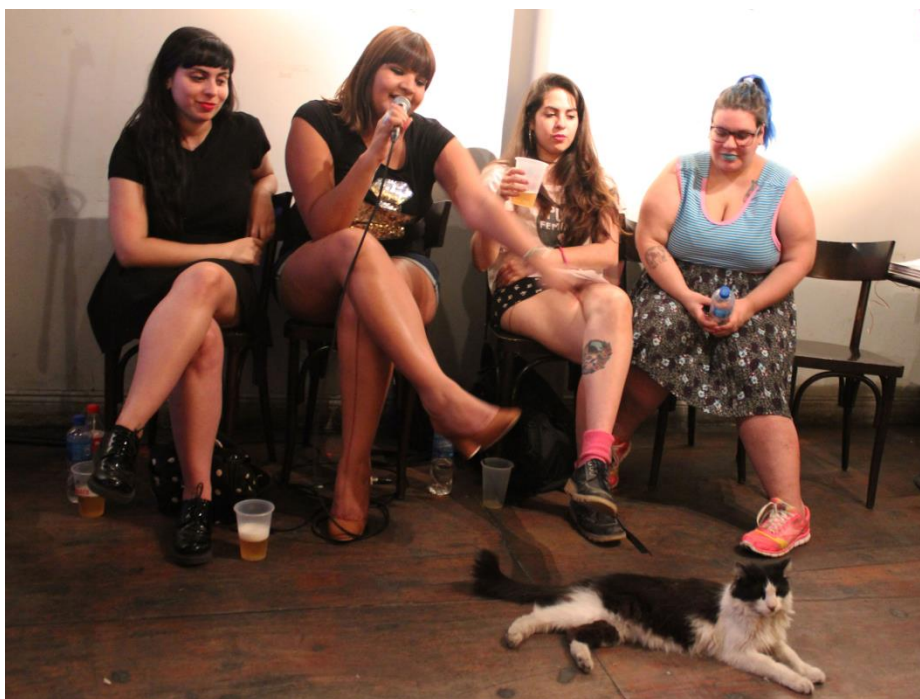
Imagen 4: Mujeres trabajadoras sexuales del sindicato AMMAR.

A partir de esta nueva visión que considera al trabajo sexual, y dentro de él a la pornografía, como un trabajo es que las y los trabajadores del rubro empezaron a organizarse en diferentes países para luchar por derechos laborales y sociales. En Argentina la Asociación de Mujeres Meretrices de la Argentina (AMMAR) es un sindicato nacional nucleado en la Central de Trabajadores de la Argentina (CTA) donde, a pesar de no ser reconocidas como trabajadoras por el Estado nacional, se organizaron para lograr visibilizar sus problemáticas y generar diálogos políticos que les permitan mejorar su situación como colectivo. El objetivo de estos nuevos discursos es claro: la pornografía (y el trabajo sexual) existe y representa un espacio donde se muestran diferentes identidades relacionadas mediante disputas de poder y, por lo tanto, ven en esos espacios la necesidad de asumirlos como propios reivindicando nuevas formas de entender el placer, el goce y la representación de esas identidades. Por este motivo se intenta encontrar un punto en el que la construcción de las corporeidades, las sexualidades y las identidades que no se ven representadas dentro del llamado porno mainstream por ser un punto de vista heterosexual, dominante y masculino, puedan tener la posibilidad de disputa. Tal es así que la post-pornografía puede ser reconocida