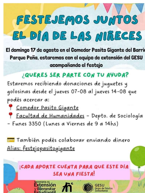
Figura 2. Flyer de difusión del festejo

En el mes de agosto, se decidió que la tercera actividad del proyecto consistiera en acompañar el festejo del Día de la Niñez organizado por el comedor Pasito Gigante, dado que las actividades previas habían estado dirigidas a otros grupos etarios. Para definir la propuesta, el equipo de extensión se reunió en el comedor y se acordó, a partir del pedido de la referente del comedor, el acompañamiento del equipo en la festividad debido a la gran cantidad de niñxs que suele convocar y a la necesidad de colaboración en la jornada. A partir de ello, se organizó una colecta solidaria destinada a la compra de alimentos, golosinas y juguetes para la celebración. Evento que igualmente fue difundido en las redes sociales del grupo (Figura 2). Una vez finalizada la colecta, el equipo se reunió el día previo al festejo para clasificar los juguetes según las edades, envolverlos y preparar las bolsitas de golosinas que serían entregadas durante la jornada (Figura 3). El día del evento participaron alrededor de treinta niñxs, acompañadxs por sus familias y vecinxs del barrio.