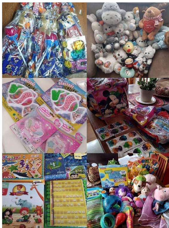
Figura 3. Preparación de donaciones