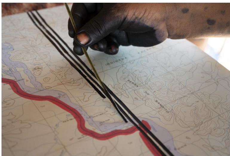
Figura 2. Registro de las pintoras trabajando sobre los mapas. Autor: Jonathas de Andrade Fuente: https://cargocollective.com/jonathasdeandrade/fome-de-resistencia

Las fotos que componen la obra Fome de resistência refuerzan, proponemos, aquellas condiciones, procedimientos y colaboraciones que volvieron posible esta intervención. La cámara fotográfica, más que intervenir para fijar estereotipos, participa y acompaña la acción de esas mujeres en la construcción de la obra. Así, las fotografías recuperan la labor de la pintura sobre los mapas, a partir de focalizaciones sobre el cuidado de las mujeres en la elaboración de sus diseños a mano alzada, de modo tal que es posible advertir, desde la certeza del trazo y desde la sedimentación de la pintura, la materialización de un saber profundamente incorporado, tan singular como colectivo.