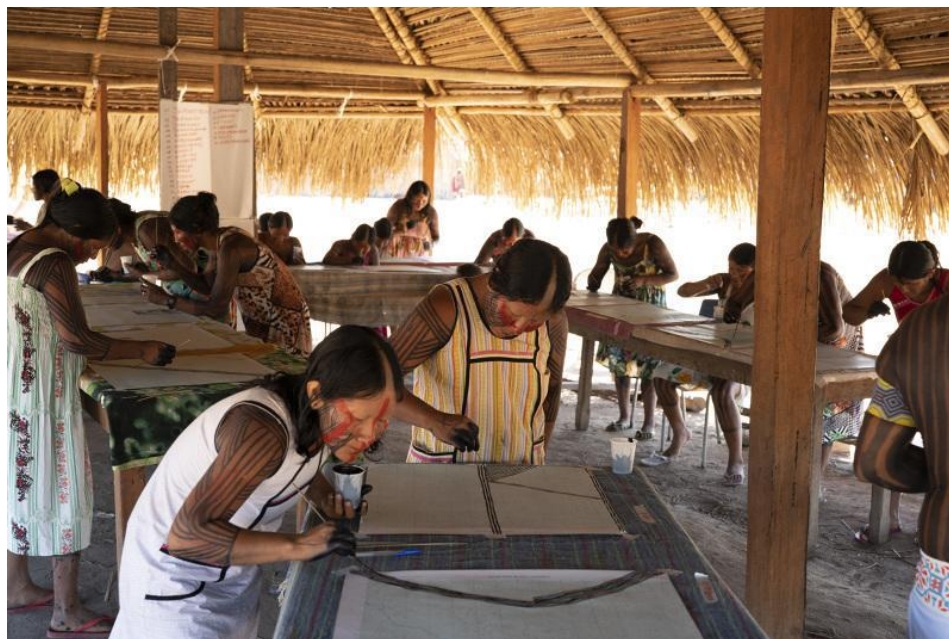
Figura 1. Registro de las pintoras trabajando sobre los mapas. Autor: Jonathas de Andrade.

Fuente: https://cargocollective.com/jonathasdeandrade/fome-de-resistencia