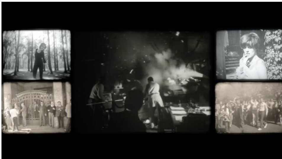
Figura 2. Fotograma tomado del film Cuatrerros (2016).

En el pasaje al monocanal se puede apreciar un movimiento doble. Un formato de esas características implicó repensar la idea de sucesión y simultaneidad que generaba la instalación. Frente a esto la directora tomó la decisión de colocar sucesivos recortes de cuadros en varios formatos y tamaños dentro del mismo lienzo de la única pantalla. Finalmente, en el segundo de los casos, el resultado de la historia son imágenes que “estallan” con mayor velocidad mientras la voz del relato nos sumerge en una sucesión constante de emociones. Este gesto es ahora una profanación radical sobre los materiales, sintetizado en palabras de la investigadora Natalia Taccetta: “No se piensa el archivo como la sacralización de un conjunto de documentos, sino como una apertura a la profanación de los posibles decibles y como un repositorio desde el cual escribir las historias no-escritas, los saberes locales históricamente marginados” (23).