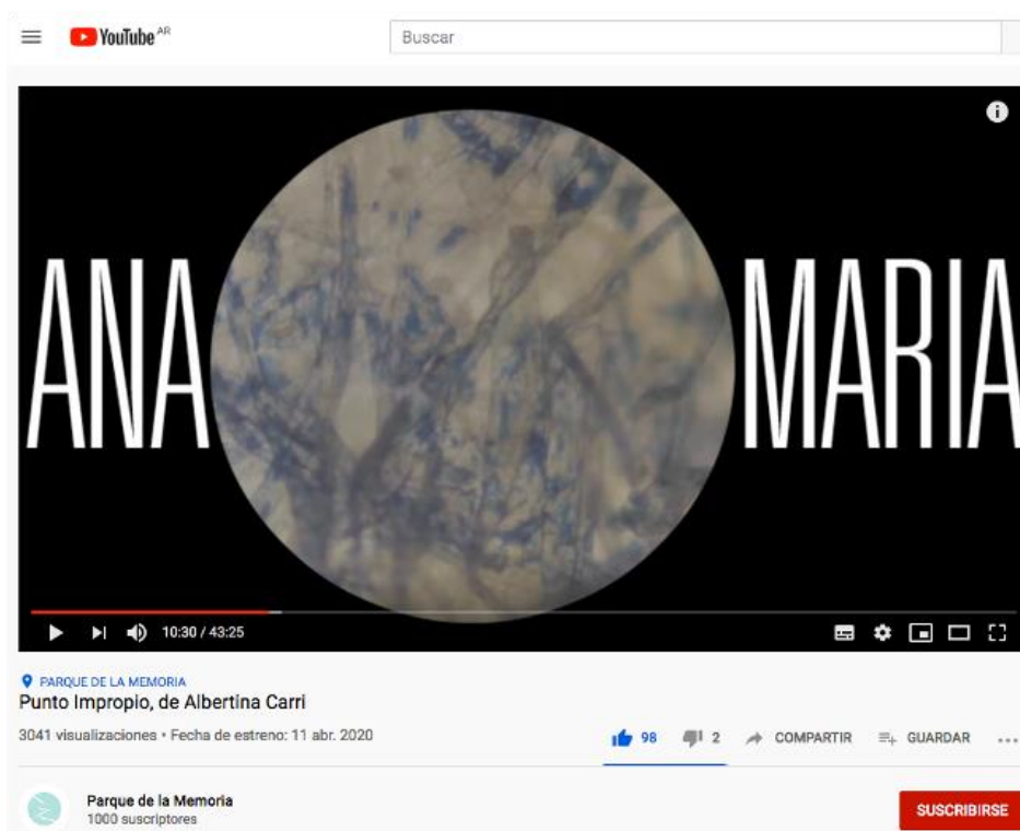
Figura 3. Captura de pantalla tomada del Canal de YouTube oficial del Parque de la Memoria (2020).

un trabajo sonoro más complejo, en donde sintetizadores electrónicos acompañan los silencios cuando la voz en off se apaga.