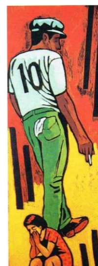
Título: Melancolía del número 1 Serie: Los siete locos Año de realización: 2011 Técnica: xilopintura Medidas: 110 x 43 cm