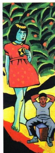
Título: Bomarzo Serie: Los siete locos Año de realización: 2011 Técnica: xilopintura Medidas: 110 x 43 cm

Valga la paradoja: tan magistral es la crónica policial de Arlt incorrectamente mezclada con su reportaje periodístico como preciosas las ilustraciones que singularmente acompañan el libro.