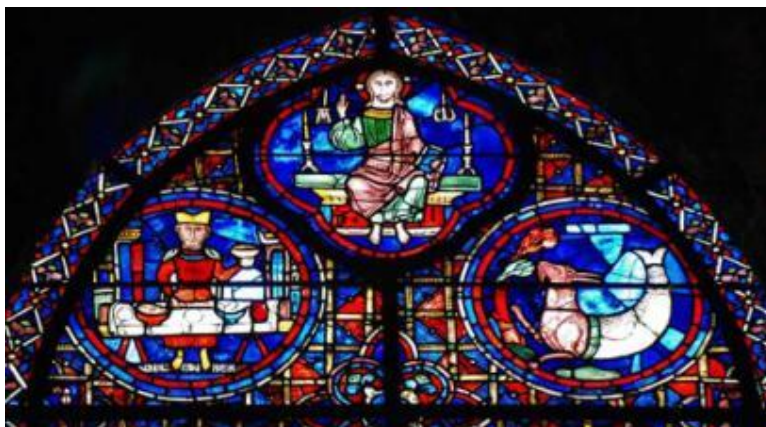
Figura 2: Vidriera del Zodíaco. Detalle.

En la iglesia de Chartres se emplazaron más de 140 vitrales incluyendo los rosetones de las tres fachadas. La mayoría de ellos fueron realizados entre 1210 y 1240. La vidriera del Zodíaco se ubica en el claristorio, a la altura del tercer tramo de la nave central, contado a partir del crucero y en dirección al ábside. Se encuentra junto al ventanal de Nuestra Señora de la Bella Vidriera, 38 está formado por 24 paneles en los que se despliegan los doce signos