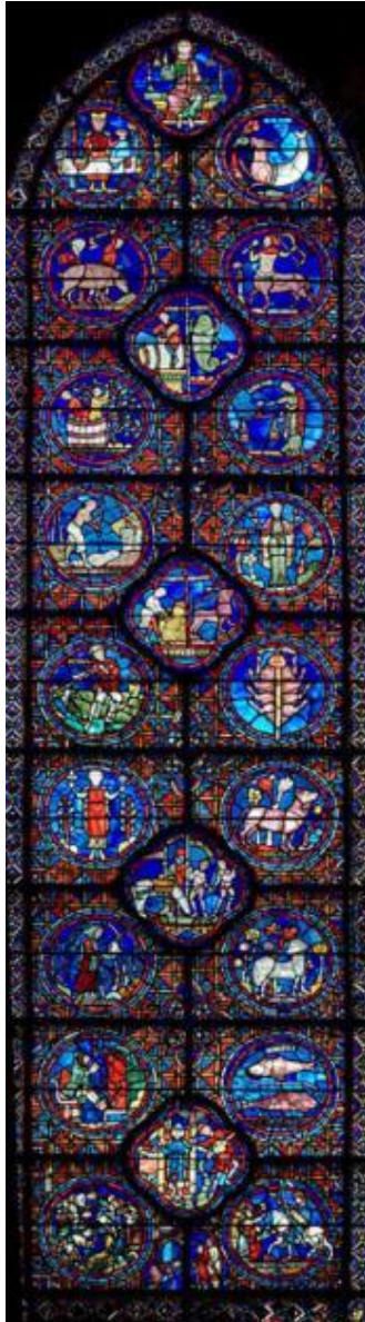
Figura 3: La vidriera del Zodíaco.