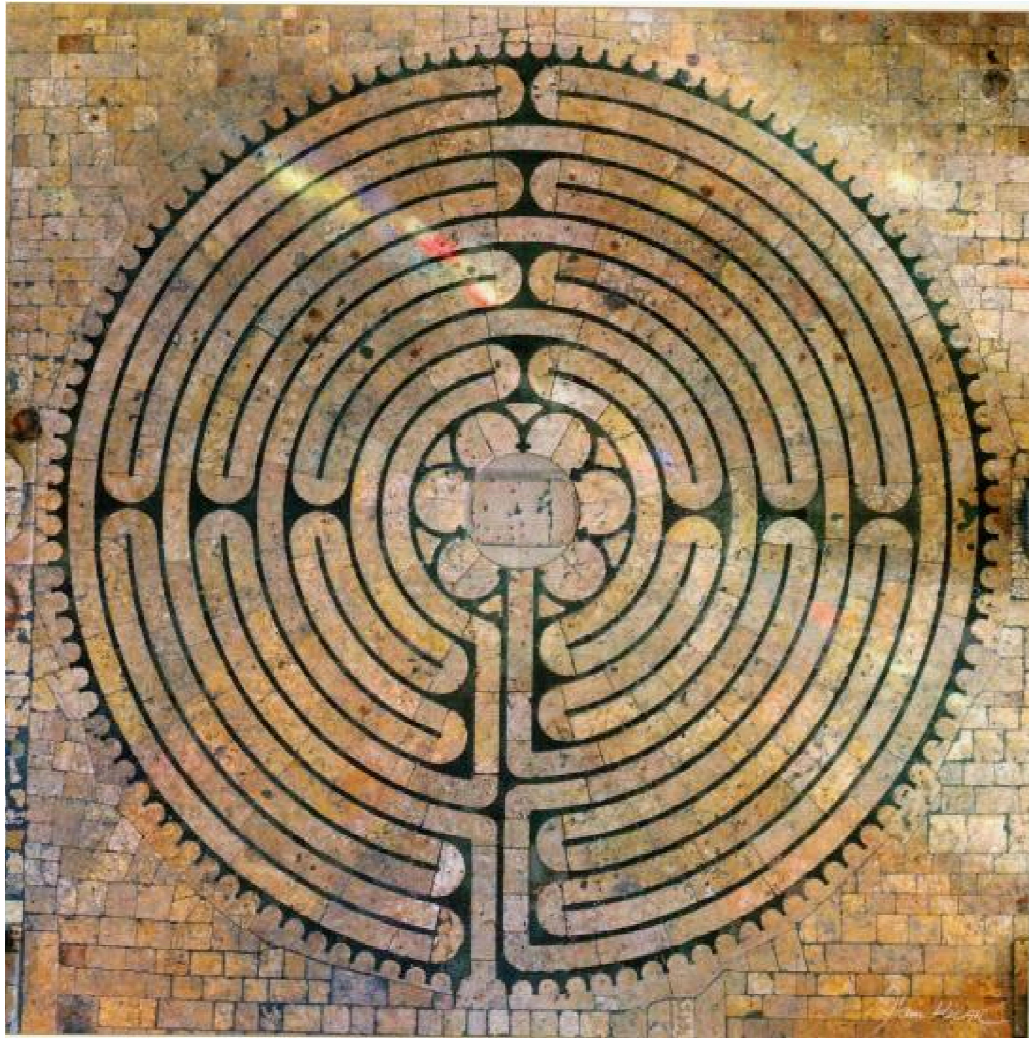
Figura 1: el laberinto de Chartres

Algunos autores afirman que los laberintos constituyen la firma de ciertas asociaciones de maestros de obras medievales. 27 Sin embargo, según J. Hani, estos diagramas no fueron simples monogramas de las compañías de constructores, sino que fueron adoptadas por éstas en virtud de su sentido alegórico. Sostiene que la figura del laberinto