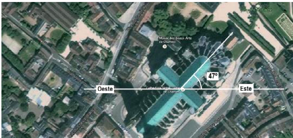
Figura 4: orientación de la planta de la iglesia de Chartres.

La iglesia de Chartres no obedece la alineación establecida por las Constituciones Apostólicas . En efecto, el eje mayor de la iglesia forma, con la dirección este-oeste, un ángulo de 47º (Figura 4). 46 47 Según hemos visto, la disposición actual de la iglesia se adecua a la de antiguas construcciones realizadas en el lugar. En particular, la planta actual se ajusta a la traza y a la orientación de la cripta de Fulberto, sobre cuyos cimientos se construyó. Este uso fue común durante toda la Edad Media. Según Otto von Simson, las criptas estaban santificadas por restos de mártires y otras reliquias allí depositadas, razón por la cual los maestros medievales respetaban la forma de las antiguas construcciones emplazadas en el lugar. 48