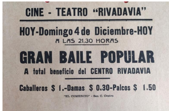
Imagen 3. Invitación al Baile organizado por el Centro, en "El Comercio".

mayo de 1936). [Imagen 3] No obstante, la discrecionalidad en el ingreso dejaba fuera a muchas personas. Esta acción, presumiblemente, minimizaba los conflictos dentro de los bailes ya que propiciaba la presencia de un universo limitado de la comunidad sancarlina.