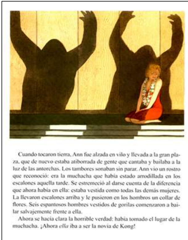
Figura 9. Browne, 2011, p.35