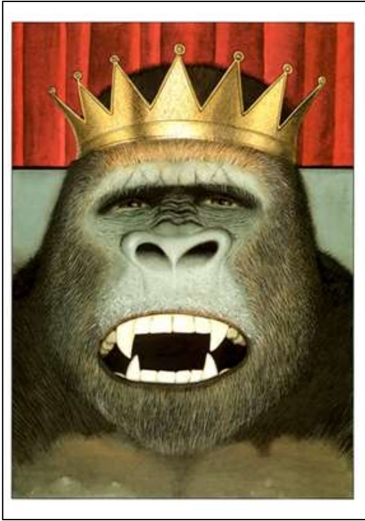
Figura 5. Browne, 2011, p. 75.