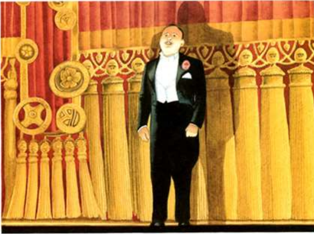
Figura 1. Browne, 2011, p. 71. 3

En un santiamén, la sala estaba llena a reventar, y cuando las luces se apagaron había un aire de emocionada expectación. Denham apareció en escena: