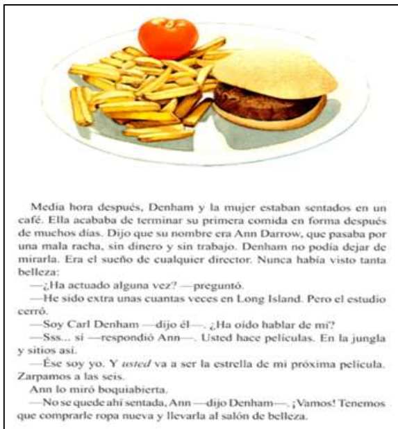
Figura 7. Browne, 2011, p. 16