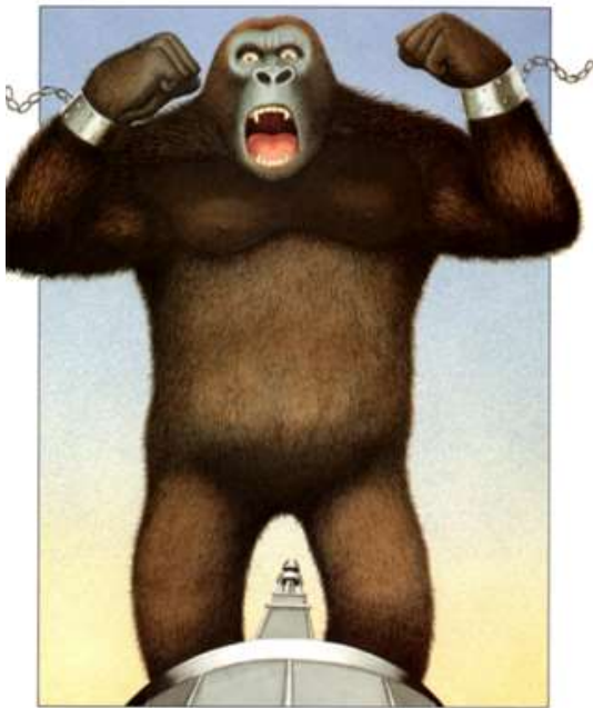
Figura 6. Browne, 2011, p. 83