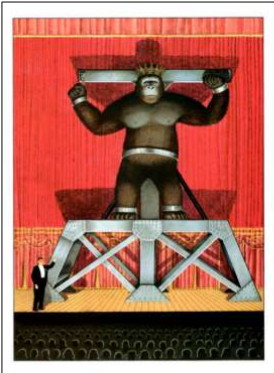
Figura 3. Browne, 2011, p. 72.