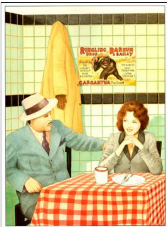
Figura 8. Browne, 2011, p. 17